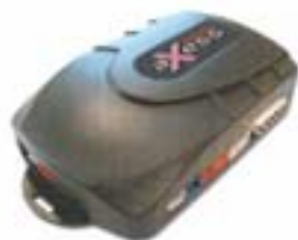
BEEPER AXESS NK™ REF : NK1 - NK2 commandé directement par les télécommandes d'origine du véhicule.

Les BEEPER AXESS™ sont des systèmes d'alarme mono-directionnels. Ils disposent de toutes les fonctions de sécurité et de confort nécessaires à la protection optimale de votre véhicule. ● LA GAMME AXESS X EST FOURNIE AVEC 2 TÉLÉCOMMANDES. ● SI VOUS SOUHAITEZ COMMANDER DIRECTEMENT L'ACTIVATION DE VOTRE SYSTÈME AXESS PAR LA TÉLÉCOMMANDE D'ORIGINE DE VOTRE VÉHICULE CHOISISSEZ LA GAMME AXESS NK .