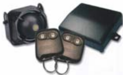
BEEPER AXESS X™ REF : X1 - X45 - X5 - X7

Les BEEPER AXESS™ sont des systèmes d'alarme mono-directionnels. Ils disposent de toutes les fonctions de sécurité et de confort nécessaires à la protection optimale de votre véhicule. ● LA GAMME AXESS X EST FOURNIE AVEC 2 TÉLÉCOMMANDES. ● SI VOUS SOUHAITEZ COMMANDER DIRECTEMENT L'ACTIVATION DE VOTRE SYSTÈME AXESS PAR LA TÉLÉCOMMANDE D'ORIGINE DE VOTRE VÉHICULE CHOISISSEZ LA GAMME AXESS NK .